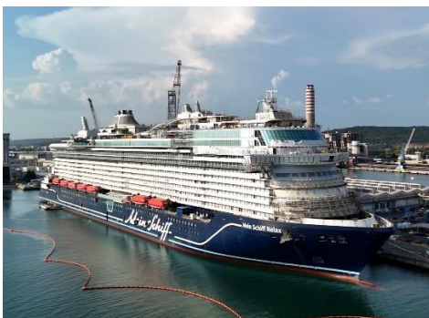
Die Mein Schiff Relax auf der Fincantieri-Werft in Italien.

Unter folgendem Link finden Sie ein aktuelles Video zur kostenfreien Einbindung in die Berichterstattung: https://youtu.be/KG6FCKCMqGs