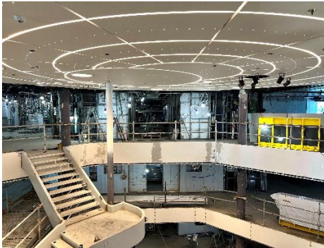
Erster Blick in das Atrium des neuen Wohlfühlschiffes.